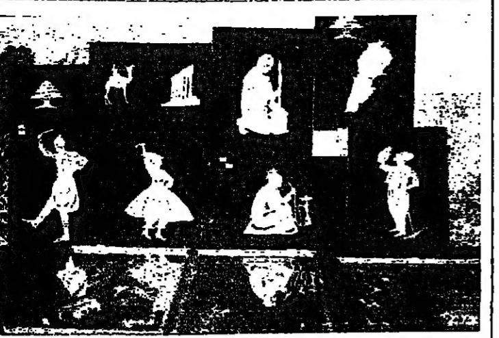
من معرض اصح